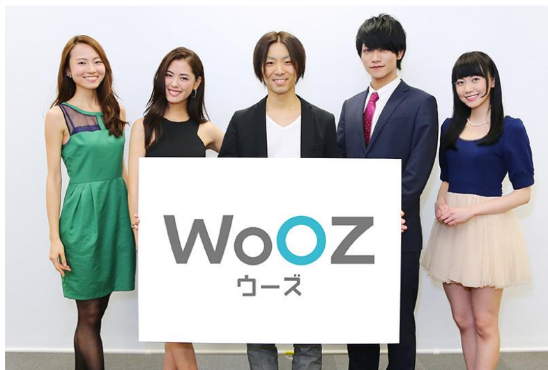
12月15日開催記者会見の様様

「WOOZ」は、グリーが培ってきたマーケティングのノウハウを活用し、クライアントの機会損失を改善するサービスです。動画広告の企画立案からタレント、モデルをはじめとするインフルエンサーのキャストイングを含む製作を、最適な価格と納品スピードで行います。また、ピンテが持つGREE ニュースなどのメディアを通じて、スマートフォン向け広告やバイラル施策などもサポートしていきます。